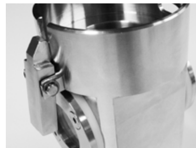
V102S Предохранительная блокировка, чтобы избежать случайного раскрытия колбы