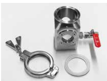
V102PU Колба с штуцером для продувки (PU), для очистки или вакуумного подключения. Также доступен с продувкой ¼" Tri-Clamp

ПОЖАЛУЙСТА, СВЯЖИТЕСЬ С НАМИ, ЕСЛИ ВАМ НУЖНО ЛЮБОЕ ДРУГОЕ ИСПОЛНЕНИЕ