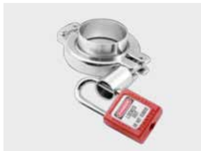
TCS Предохранительный замок для Tri-Clamp